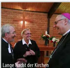
Lange Nacht der Kirchen