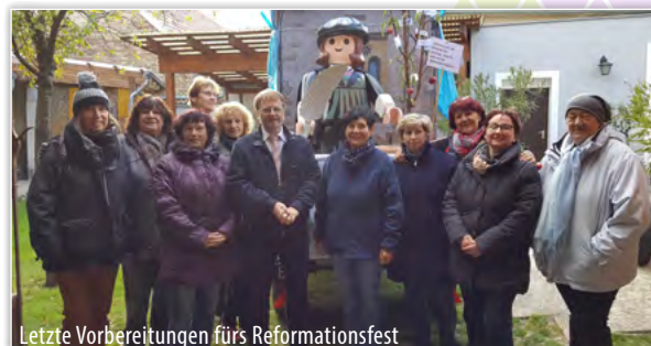
Letzte Vorbereitungen fürs Reformationsfest