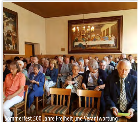
Sommerfest 500 Jahre Freiheit und Verantwortung