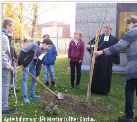
Apfelbaum vor der Martin Luther Kirche