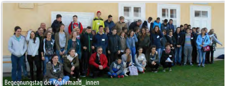
Begegnungstag der Konfirmand_innen