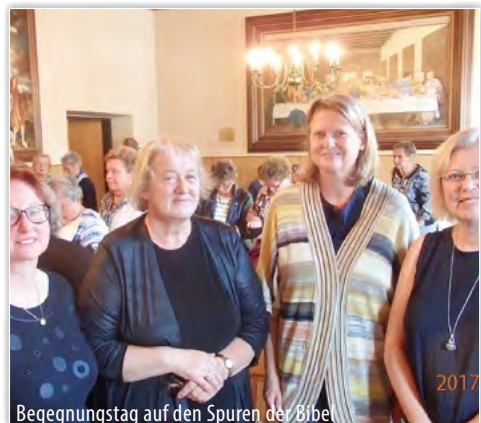
Begegnungstag auf den Spuren der Bible